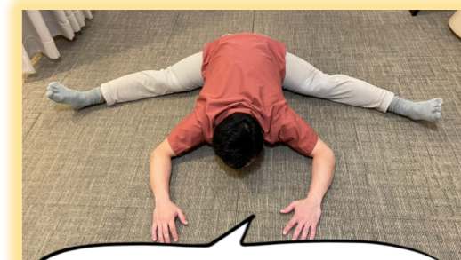
こんなに開くようになるよ!