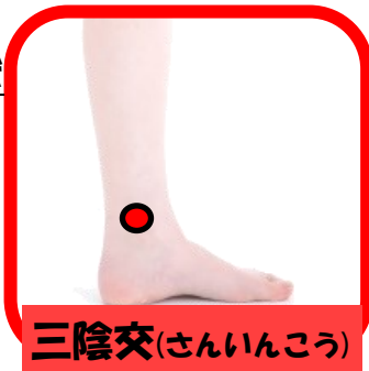
三陰交(さんいんこう)