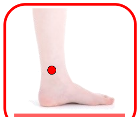
三陰交(さんいんこう)