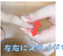
左右にスライドする！

この時、少しですが関節がずれるように動くのが正常で、動きが少ない、動かないものが指の硬さがある。という状態になります。