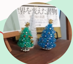
山野井さんの手作り！