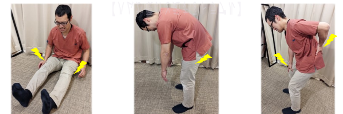
【ハムが硬いと起きるトラブル】